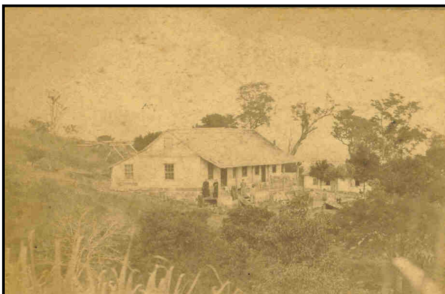
Antiga residência da família de Conrado Zimmer na Linha Teutônia, Colônia Santo Ângelo (lote número 4).