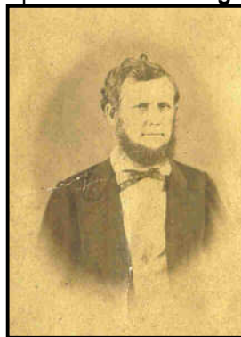
Jovem membro da família Zimmer. Agudo, década de 1880.